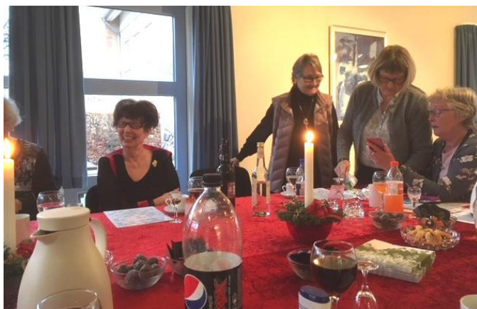
Billederne er fra cafeens julefrokost den 18/12-17