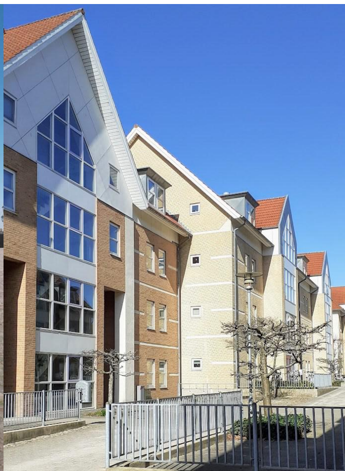
Himmelstræbende gavle i afdæmpede pastelfarver - i Jakriborg og i Lundemarken

mæssige ligheder med middelalderens arkitektur - og Jakriborg.