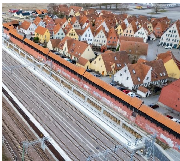
En bymur adskiller Jakriborg fra den moderne jernbane og station udenfor.